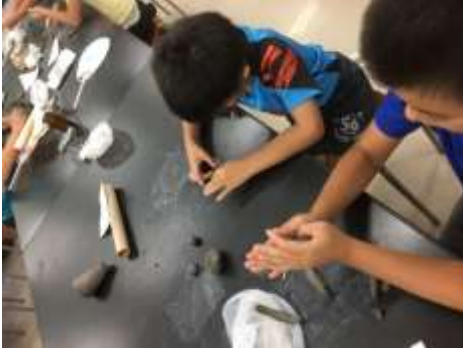
さあ、風鈴をつくろう。