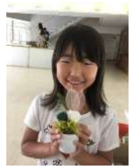
フリザーズドフラワーにチャレンジ!