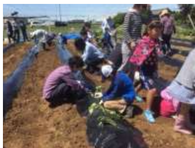
サツマイモの苗さし

さつまいもの苗さしと大豆の種を撒きました。一緒にトマトの苗も植え、収穫物をワークショップで活用予定です。地産地消体験の始まりです。 福釜町「まちの学校 農園」