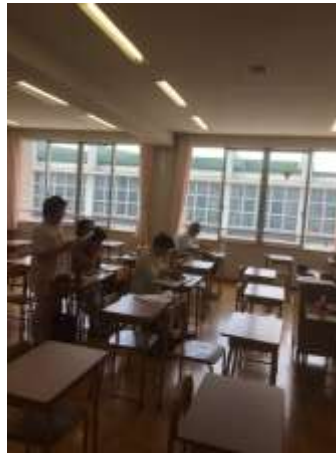
お母さんも一緒に楽しめます